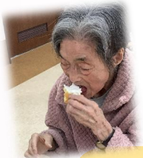
春のおやつバイキング